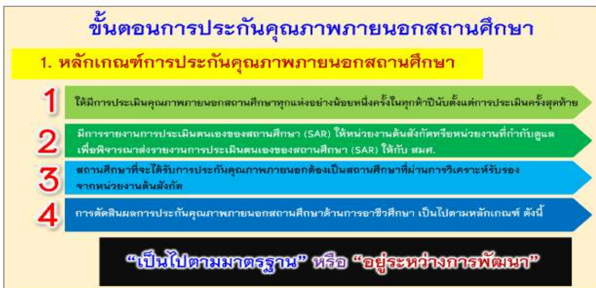
ภาพที่ 4 แสดงหลักเกณฑ์การประกันคุณภาพภายนอกสถานศึกษา

ขั้นตอนการประกันคุณภาพภายนอกสถานศึกษา แสดงดังภาพที่ 4-5