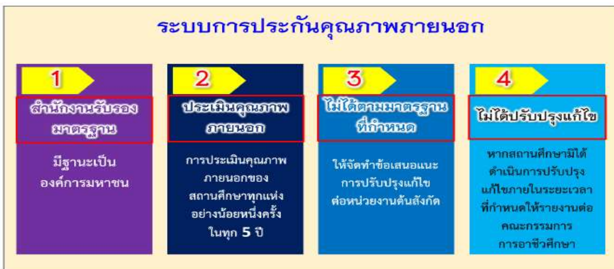
ภาพที่ 3 แสดงระบบการประกันคุณภาพภายนอก

4. หากสถานศึกษามีได้ดำเนินการปรับปรุงแก้ไขภายในระยะเวลาที่กำหนดให้สำนักงานรับรองมาตรฐานและประเมินคุณภาพการศึกษารายงานต่อคณะกรรมการการอาชีวศึกษาเพื่อดำเนินการให้มีการปรับปรุงแก้ไขระบบการประกันคุณภาพภายนอก แสดงดังภาพที่ 3