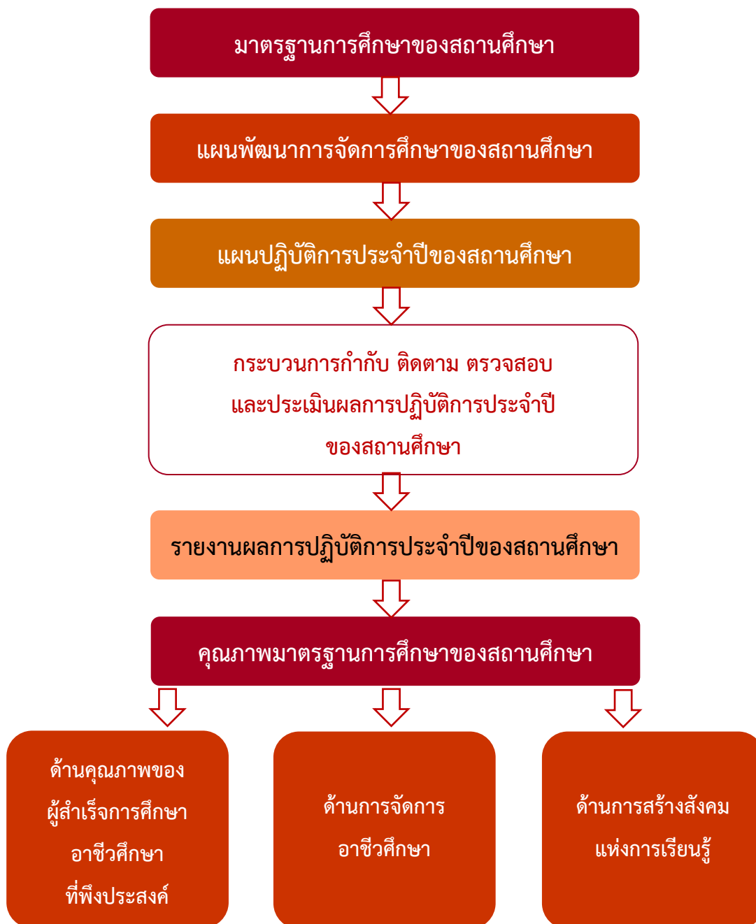
ภาพที่ 2 ความสัมพันธ์ของมาตรฐานการศึกษา แผนพัฒนาการจัดการศึกษาของสถานศึกษา และแผนปฏิบัติการประจำปีของสถานศึกษา