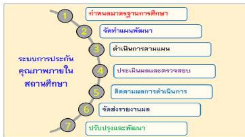
ภาพที่ 1 แสดงระบบการประกันคุณภาพภายในสถานศึกษา

ระบบการประกันคุณภาพภายในสถานศึกษา แสดงดังภาพที่ 1